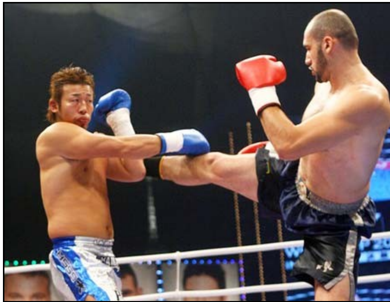
Musashi ja Feitosa vuoden 2005 K-1 GP finaalissa.

K1:n kehitti japanilainen Kyokushinkai-karateka Kazuyoshi Isha. Ishaalla oli aikaisemmin oma karateliitto Seido-kaikan karate ja hänen tavoitteena oli selvittää kuka on maailman paras pystyottelija. K-1 nimi viittaa kamppailu-urheilun kuninkuusluokkaan kuten Formula 1 autourheilussa.